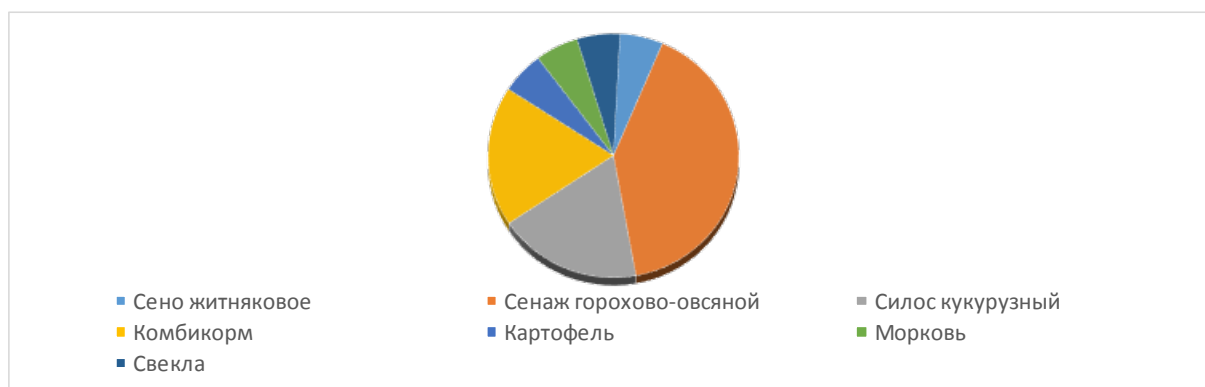
Рисунок 1 – Состав зимнего рациона дойных коров в ТОО «Олга Садчиковское»

Принимая во внимание, что алиментарный фактор является основным обстоятельством нарушения воспроизводительной способности у коров, мы исследовали кормовой рацион коров в ТОО «Олга Садчиковское» в стойловый период. Анализ химического состава корма позволяет получить информацию о его питательной ценности и качестве, что является важным при выборе и использовании кормовых материалов для животноводства. Этот метод исследования способствует оптимизации рационов, повышению эффективности воспроизводства и обеспечению здоровья животных. Перечень задаваемых кормов в ТОО «Олга Садчиковское», представлен на рисунке 1.