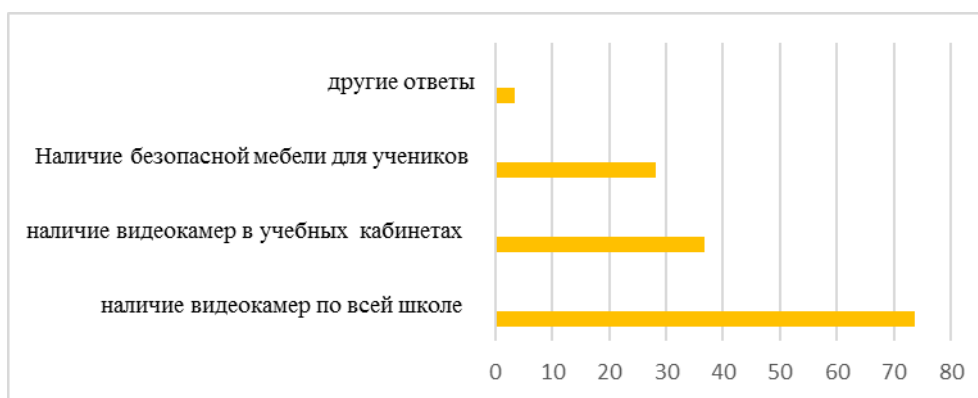
Рисунок 2 – Безопасность школьных учреждений

На вопрос каким оборудованием должен быть оснащен кабинет социального педагога-эргономиста, обучающиеся выделили следующее: