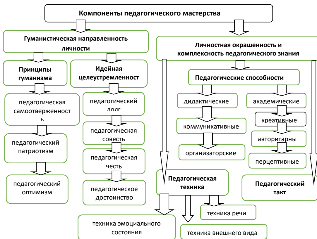
Рисунок 2 – Компоненты педагогического мастерства

Но одного долга недостаточно, чтобы успешно осуществлять педагогический процесс. Необходима педагогическая совесть, которой сопутствует такая категория, как стыд. Совесть и стыд не позволят преподавателю совершать действия и поступки, несоизмеримые с педагогической профессией, с честью преподавателя.