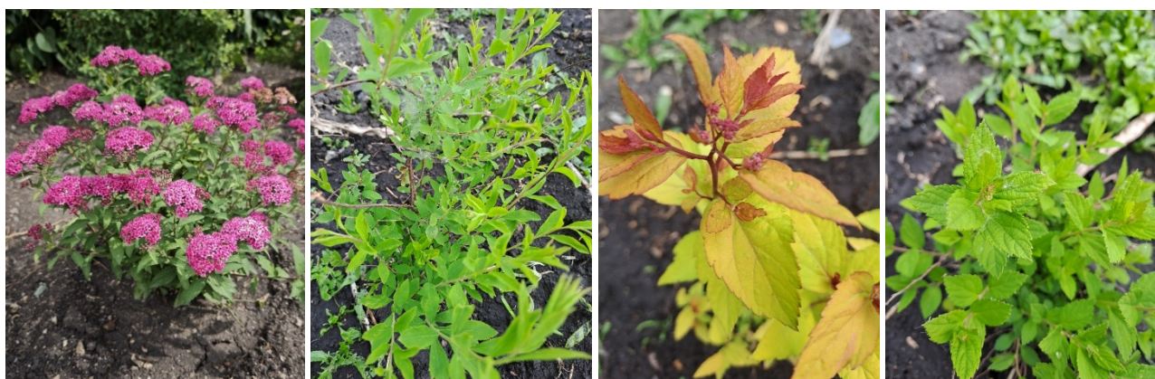
S. «Dart's Red» S. «Arguta» S. japonica «Firelight» S. «Little Princess»