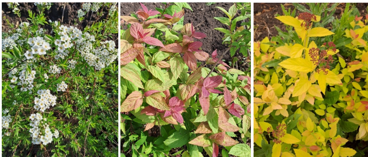
S. xcinerea Zabel, S. « Macrophylla » S. japonica « Goldflame »

На рисунке 1 запечатлены некоторые представители рода Spiraea в разные сроки вегетационного периода, растущие в коллекциях.