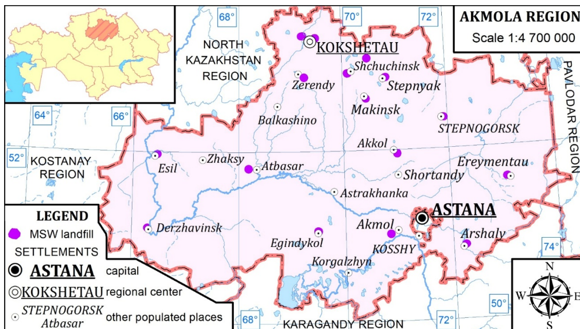
Рисунок 1 – Расположение исследуемых полигонов ТБО на территории Акмолинской области

Объектом исследования являлись почвы и фильтрат действующих и несанкционированных полигонов твёрдых бытовых отходов (ТБО), расположенных в пределах Акмолинской области Республики Казахстан (рисунок 1).