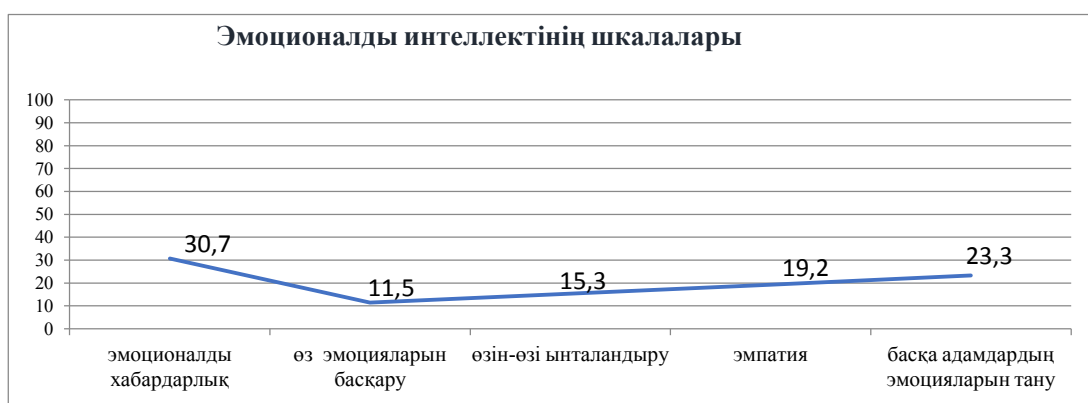
Сурет 1. – Анықтаушы кезеңінің эмоционалды интеллект шкалалардың нәтижесі (Н.Холлдың «Эмоционалды интеллект»)

Зерттеу жұмысының анықтау кезеңінде Н.Холлдың «Эмоционалды интеллект» әдістемесі арқылы алынған нәтиже 1-ші суретте көрсетілген.