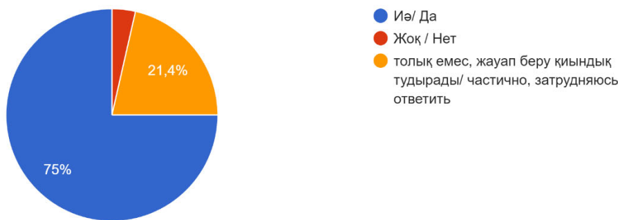
1-сурет – «Психосоматика» немесе «психосоматикалық бұзылыс» түсініктеріне қатысты сауал жауаптары

«Психосоматика» немесе «психосоматикалық бұзылыс» түсініктері жайлы білесіз бе? / Знаете ли вы о таких понятиях как "психосоматика" или "психосоматическое нарушение"? 28 ответов